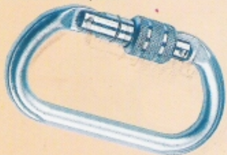
71114 Inel aluminiu cu șurub 71114 Inel aluminiu cu șurub