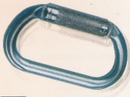
71111 Inel oțel automat 71111 Inel oțel automat