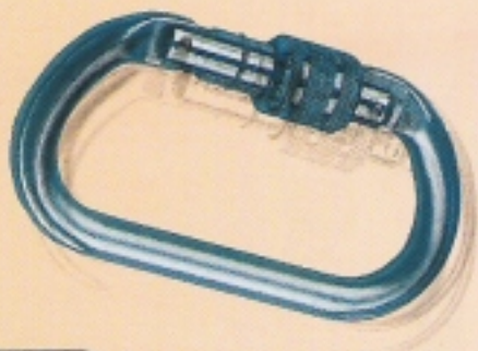
71110 Inel oțel cu șurub 71110 Inel oțel cu șurub